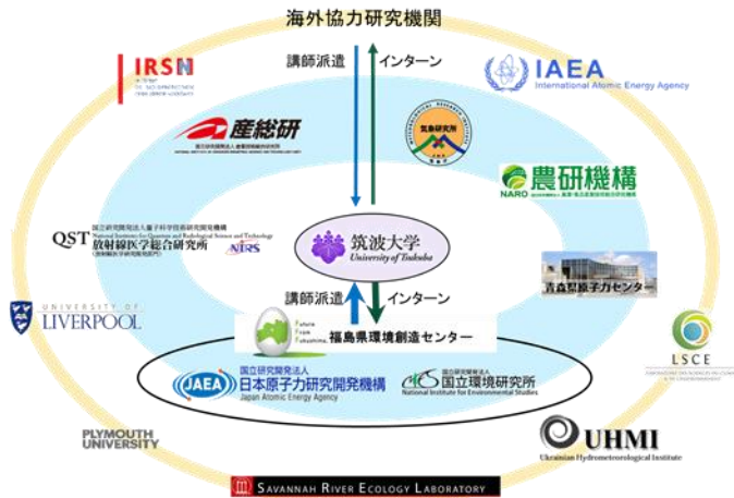
プログラム教育体制

環境科学専攻で修得できる環境に関する俯瞰的な知識を基礎に、講義を通して放射性核種の環境動態や原子力災害による環境への影響評価、リスク管理に関する高い専門性を涵養します。さらに、海外講師によるレクチャーや、インターンシップ、海外実習により現場理解力と実践的能力を身につけます。プログラムは、国内外の連携機関の協力のもと、機関横断的な教育体制を構築しました。